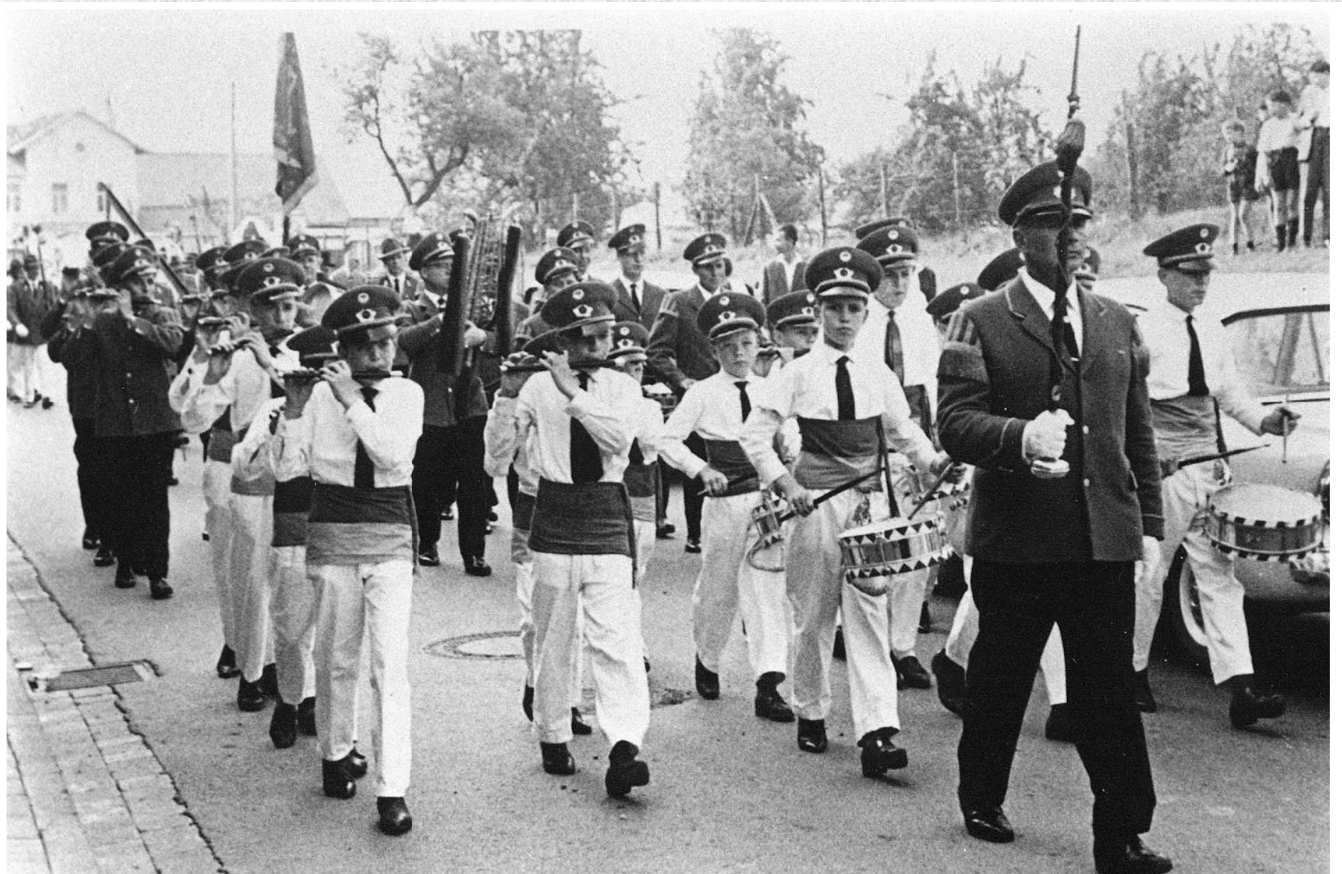
Trommler- und Spielverein Setterich im Jahre 1964