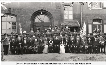
Die St. Sebastianus Schützenbruderschaft Setterich im Jahre 1953