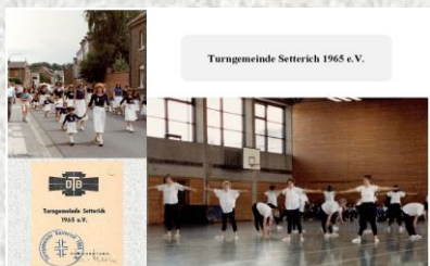
Turngemeinde Setterich 1965 e.V.