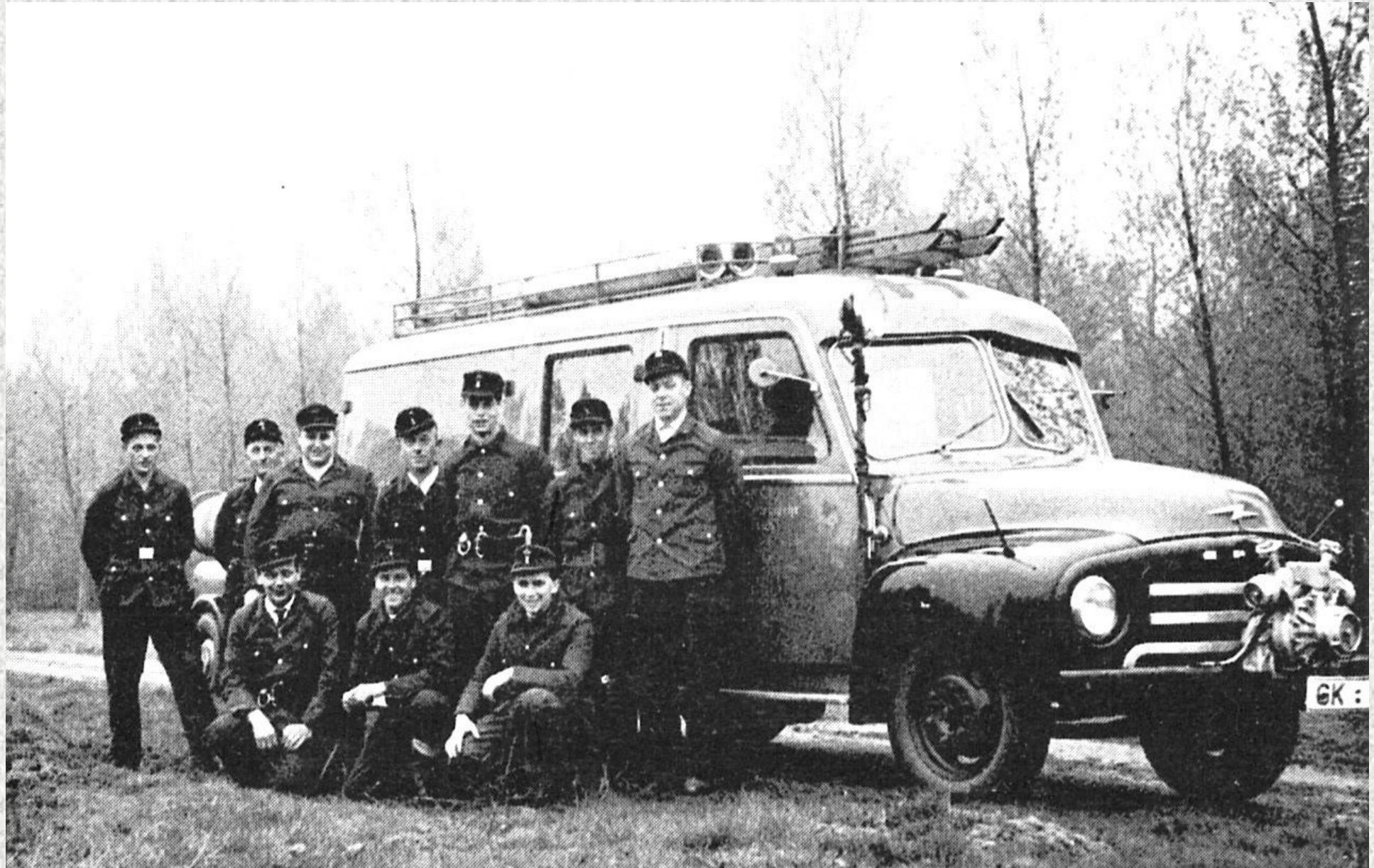
Die Freiwillige Feuerwehr Setterich mit ihrem ersten Löschfahrzeug LF 8/8 im Jahr 1958