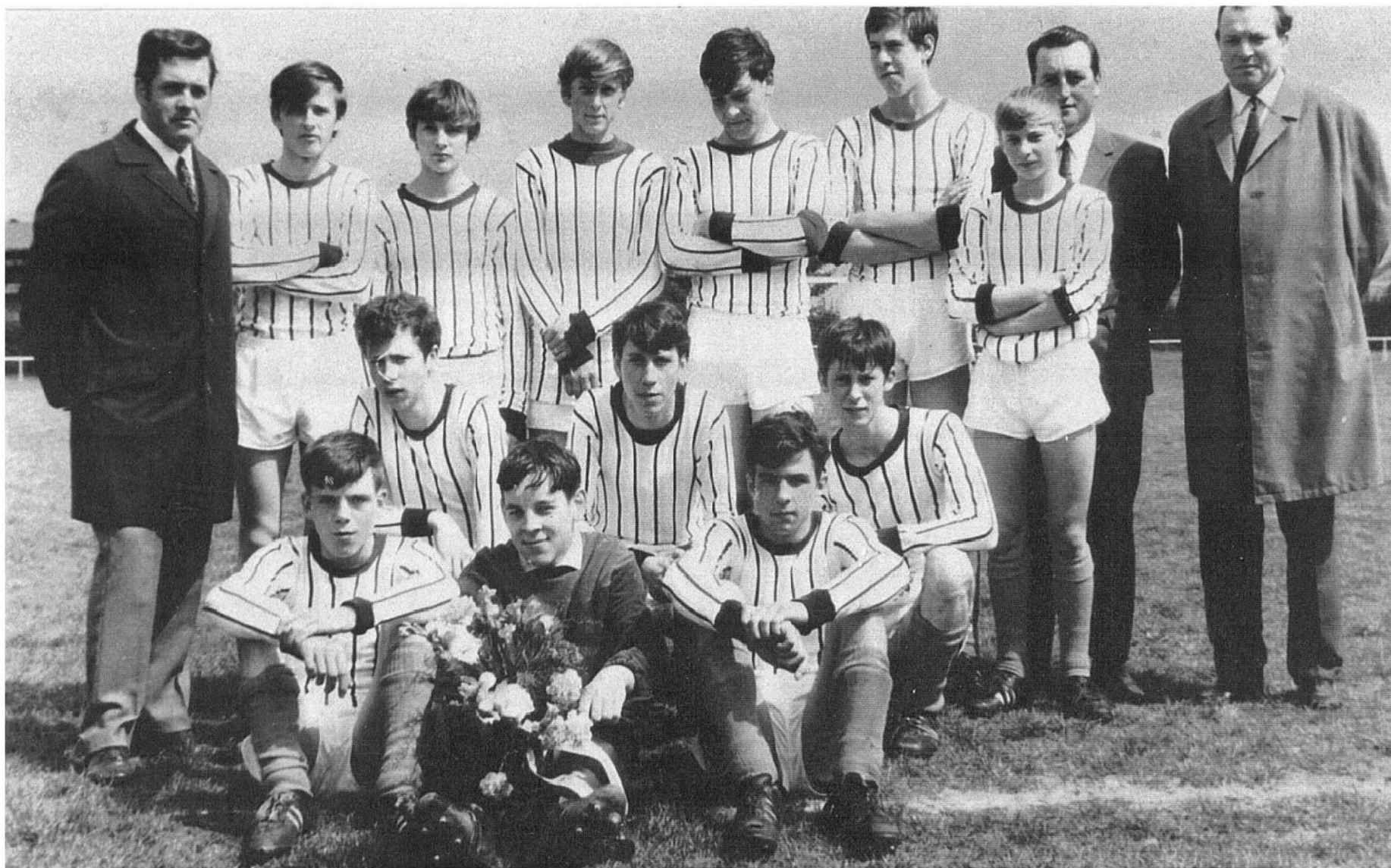
SV 07 Setterich B Jugend in der Spielzeit 1967 / 1968