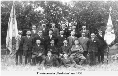
Theaterverein „Frohsinn“ um 1930