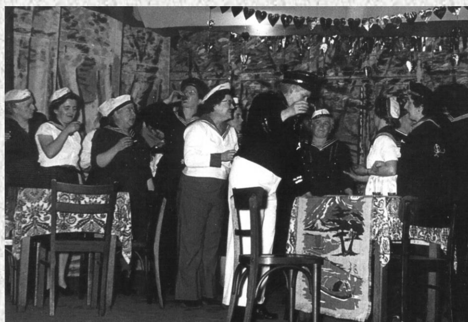
Ob KG Alaaf oder Invalidenverein, ob Frauengemeinschaft oder KAS: Dreimol Setterich Alaaf !