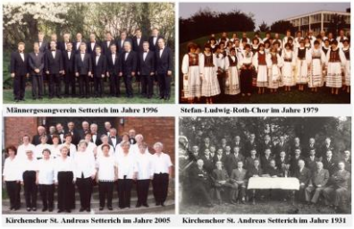
Männergesangsverein Setterich im Jahre 1996