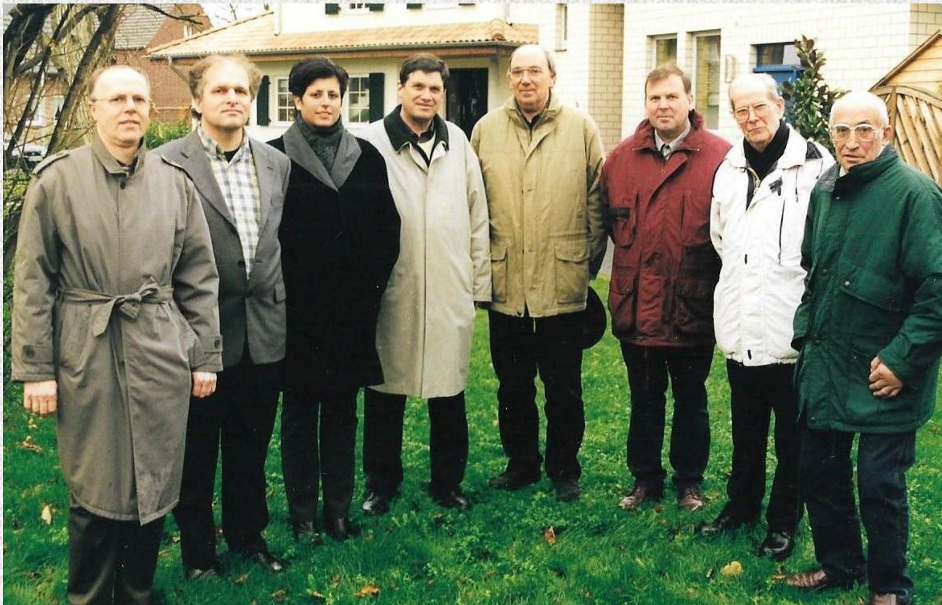
Erster Vorstand des Geschichtsvereins Setterich e. V. im Jahre 2000