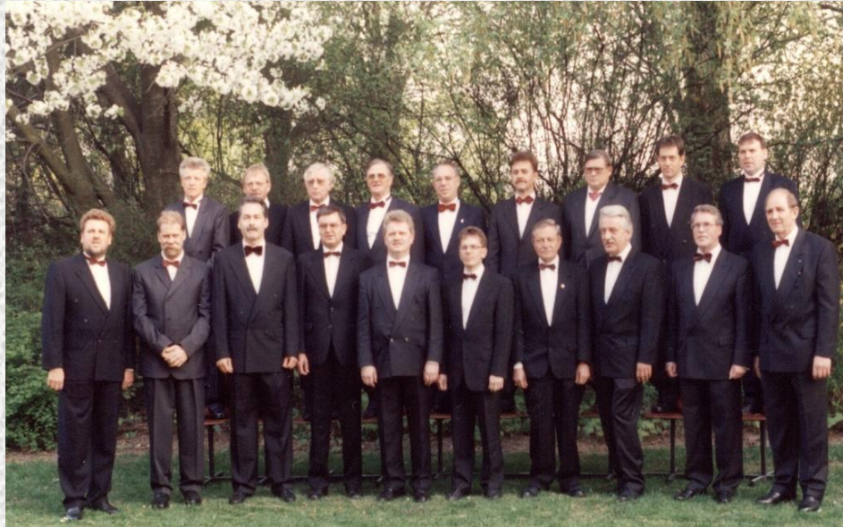
Männergesangverein Setterich im Jahre 1996