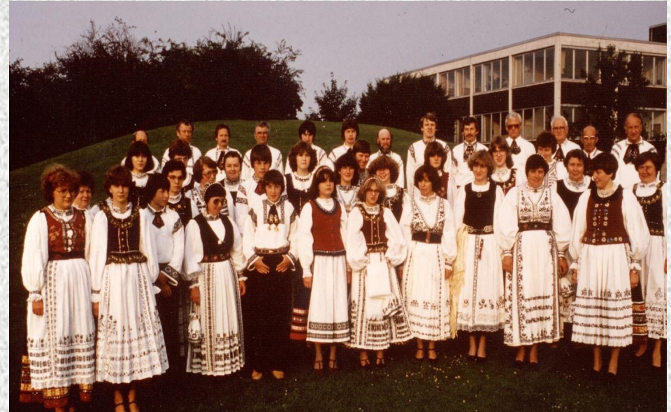
Stefan-Ludwig-Roth-Chor im Jahre 1979