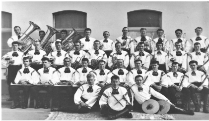
Blasmusikkapelle "Siebenbürgen" Setterich e.V. im Jahre 1988