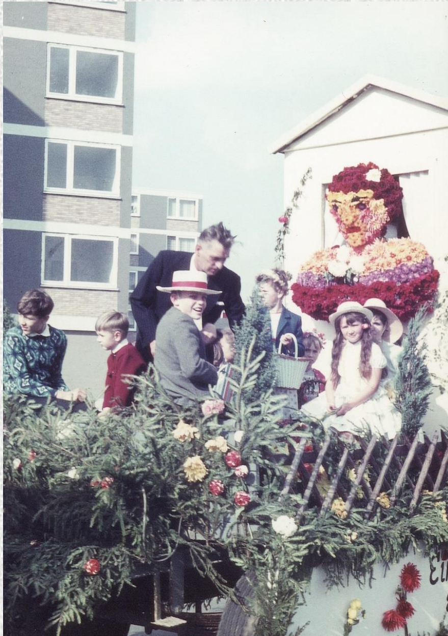
1965 Umzug zum 10jährigen Bestehen der Gartenbau- und Siedlergemeinschaft Setterich