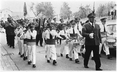
Trommler- und Spielverein Setterich im Jahre 1964