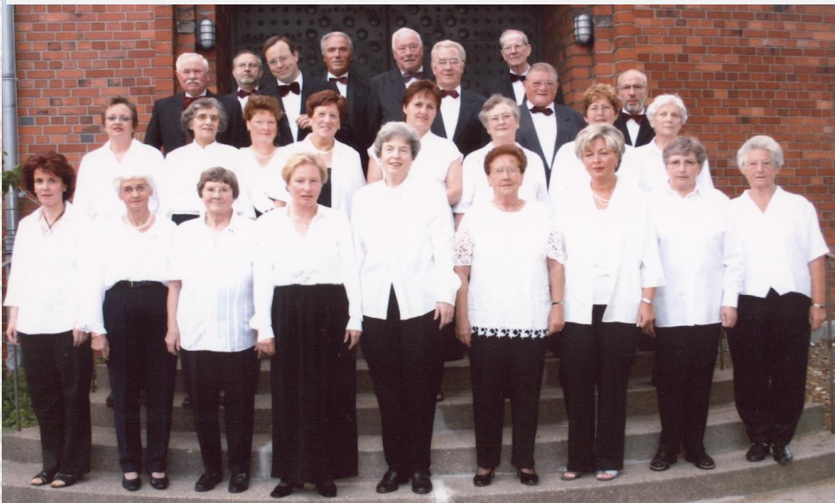
Kirchenchor St. Andreas Setterich im Jahre 2005