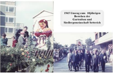
1965 Umzug zum 10jährigen Bestehen der Gartenbau und Siedlergemeinschaft Setterich