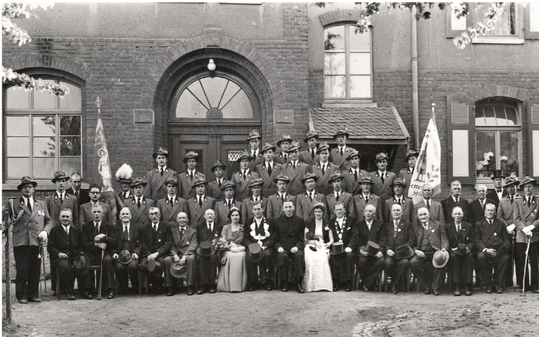
Die St. Sebastianus Schützenbruderschaft Setterich im Jahre 1953