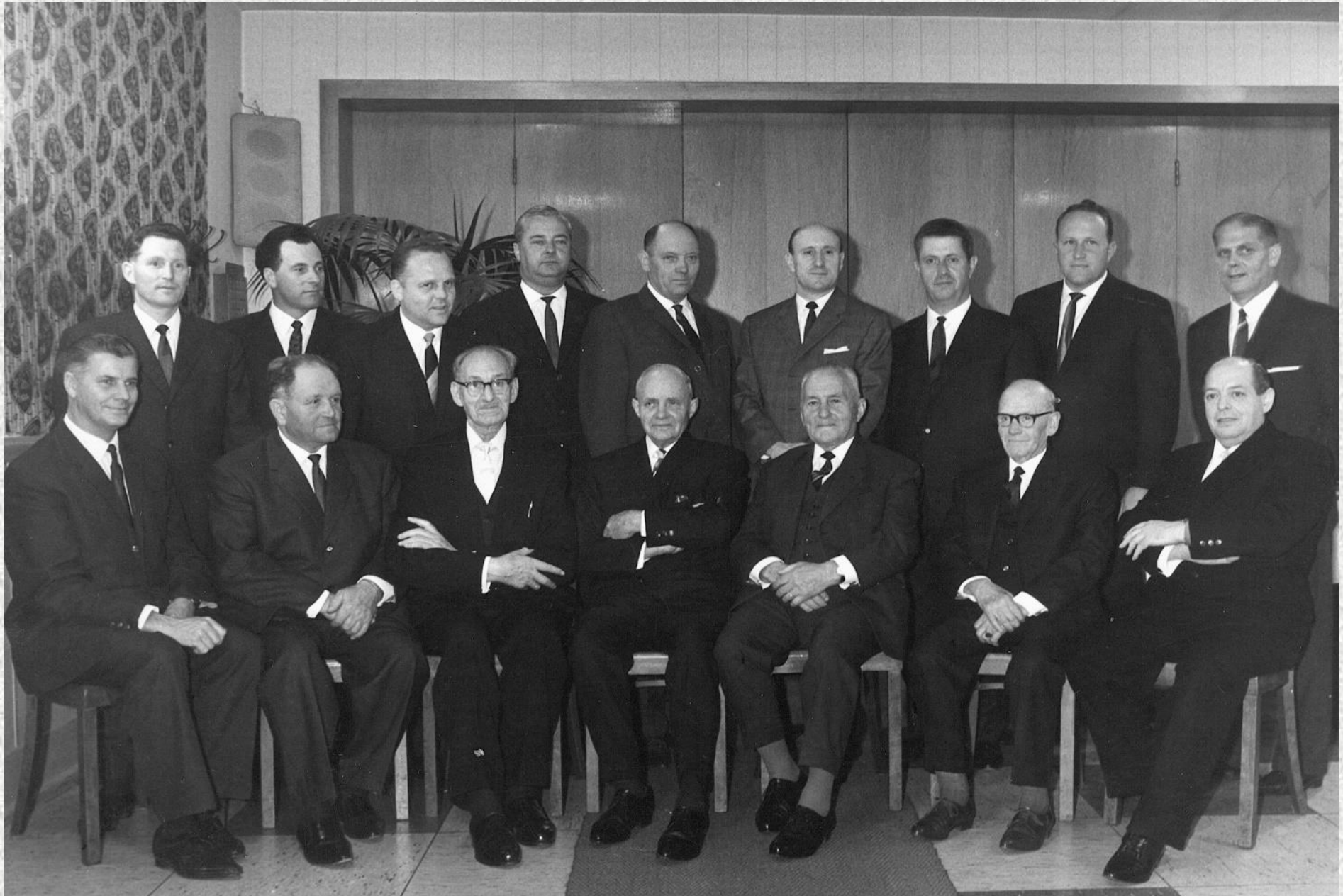
Kegelclub „Freie Bahn“ im Jahr 1967