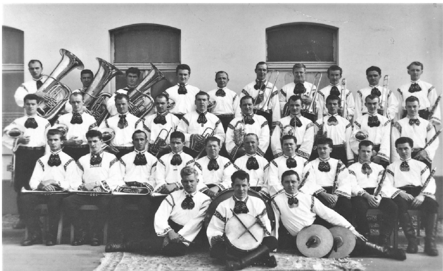
Blasmusikkapelle "Siebenbürgen" Setterich e.V. im Jahre 1958