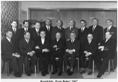
Kegeclub „Freie Bahn“ 1967