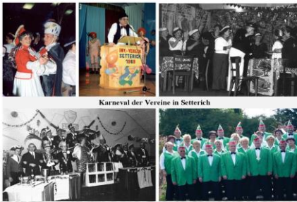
Karneval der Vereine in Setterich