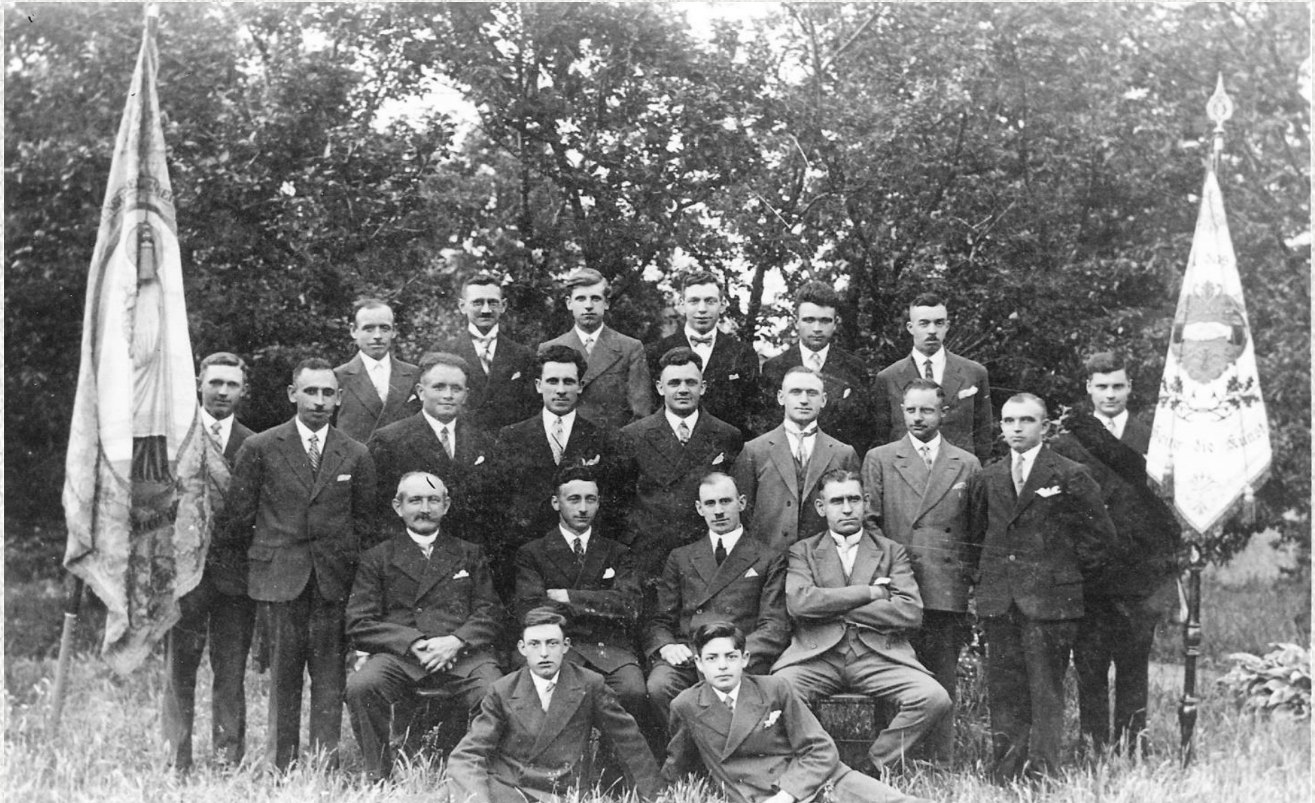
Theaterverein „Frohsinn“ um 1930