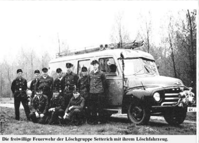
Die freiwillige Feuerwehr der Löschgruppe Setterich mit ihrem Löschfahrzeug.