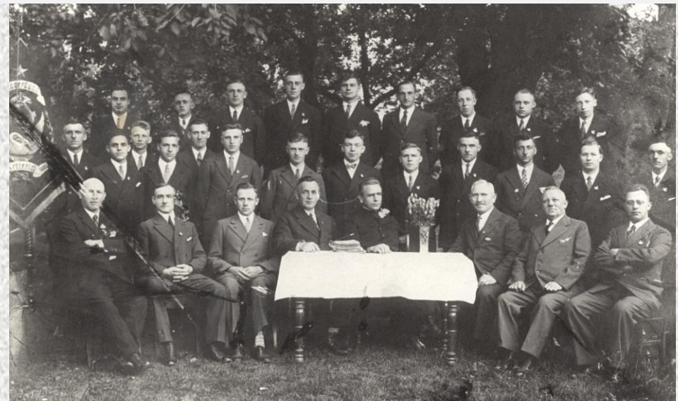
Kirchenchor St. Andreas Setterich im Jahre 1931